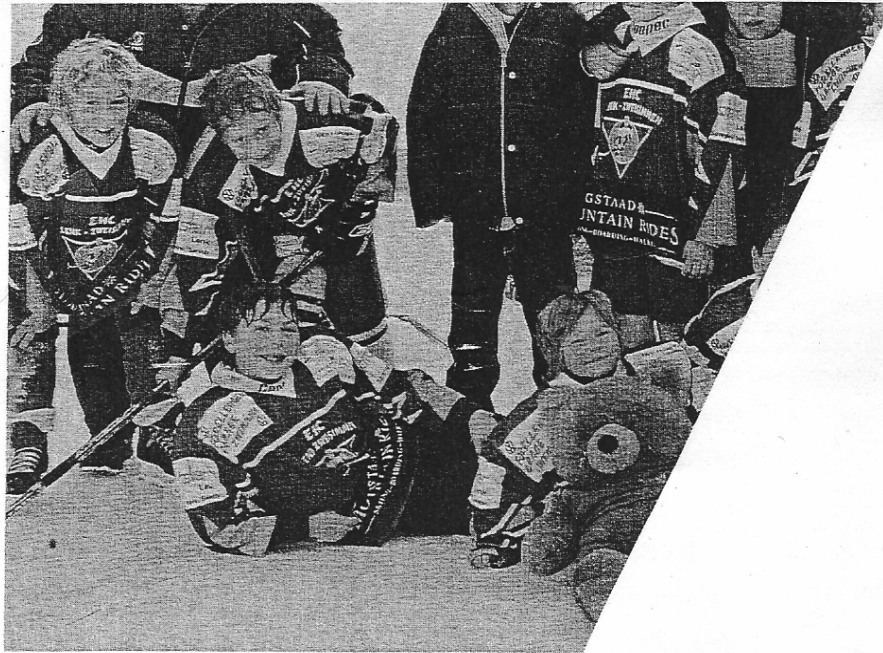
Die erfolgreiche Mannschaft der Piccolo mit ihren Betreuern.